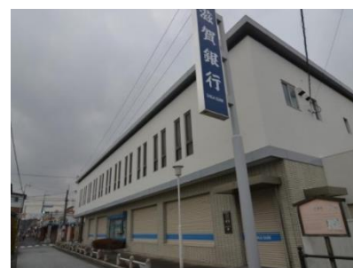
滋賀銀行八幡支店