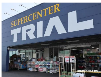
トライアル近江八幡店