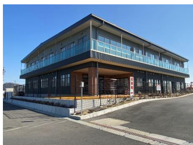
岡山紫雲こどもみらい園